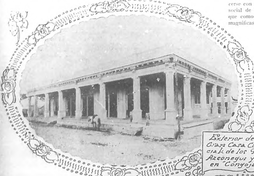
Exterior de la Gran Casa Comercial de los Sres. Azconegui y Hno. en Congojas.

Es necesario, para atender a negocios diversos y hacer una como multiplicación de energías, poseer un espíritu lleno de actividad y de pasión por el adelantamiento, como sucede con los señores propietarios de esta gran casa comercial, que describimos a grandes rasgos en BOHEMIA. De este modo que dejamos señalado, ellos han logrado hacerse