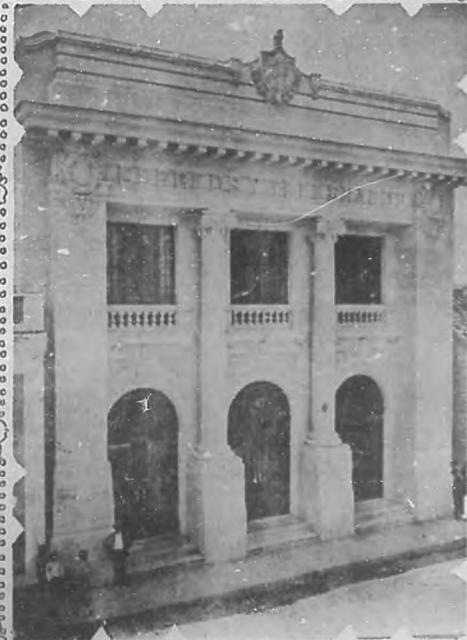
Edificio de Correos y Telégrafos.

buen motivo de embellecimiento para la población donde ha sido creado.