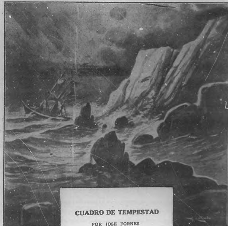
CUADRO DE TEMPESTAD