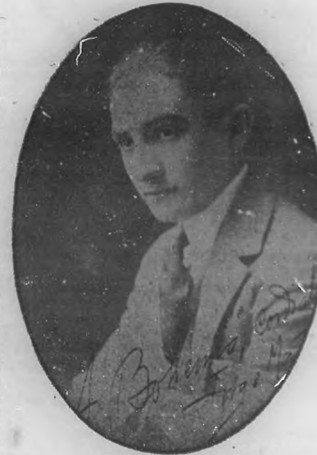
DR. JORGE MAÑACH

Entre tanto, inconscientes parvenus, nuestra vida social y política está siendo viciada por la facilidad con que hacemos dinero. Vivimos en la ilusión de que progresamos, porque se hinchan nuestras arcas; el bienestar económico, halagüeño a nuestro sibilantismo criollo, nos está nublando el cerebro con eufépticos vapores. No vemos nuestros problemas. Un polvillo de venturina cubre nuestra vida nacional. Hay en el ambiente un febricitante empeño materialista, una opacidad de valores, una ignorancia supina de adónde vamos y cómo vamos. La opulencia fácil que nos baña ha debilitado todas las energías verdaderamente fecundas. Hemos perdido, o estamos perdiendo, la unión de los intereses morales e intelectuales. Nuestra sociedad se pudre en oro.