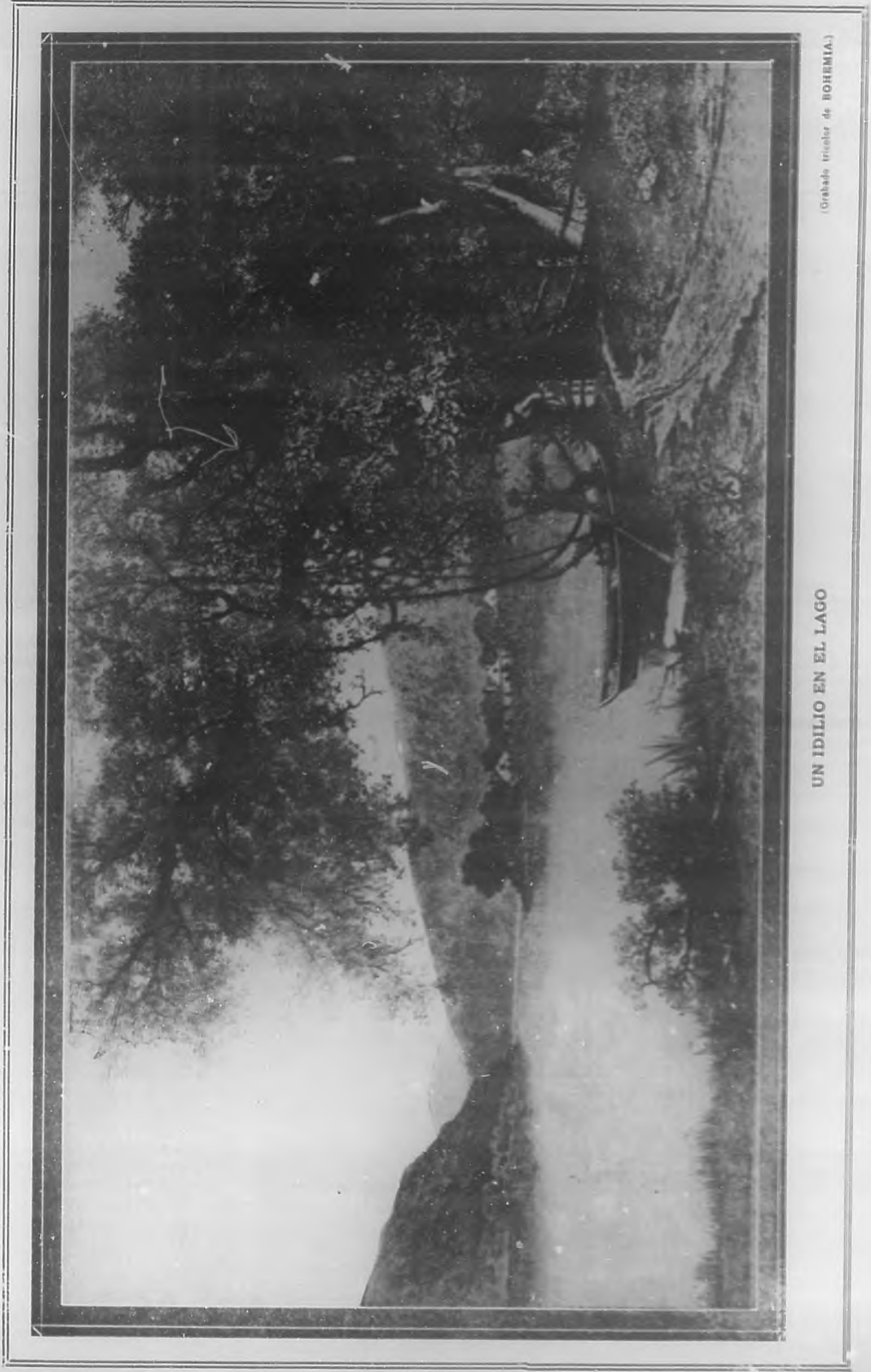
(Grabado tricolor de BOHEMIA)

Mientras me describía una batalla en la cual cayó herido, me mostró dieciséis cicatrices. Al ver aquel pecho arrugado, tantas veces perforado por el proyectil de sus adversarios, me pareció leer en él e