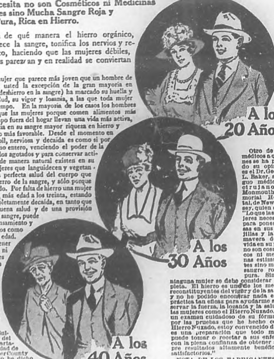
A los 20 Años